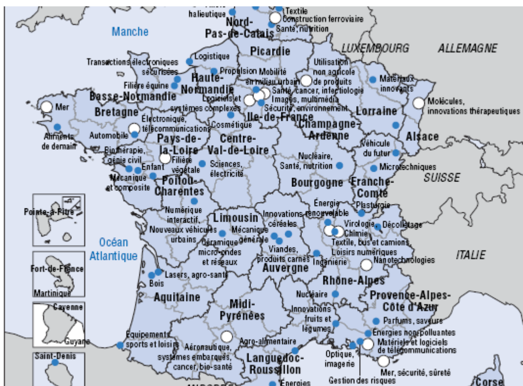
Carte des poles de compétitivité

Remarque : les implantations des poles sont des approximations . Elles sont indiquées à partir de l'adresse du déposant du dossier, mais ne précisent pas le territoire effectivement couvert par le pole.